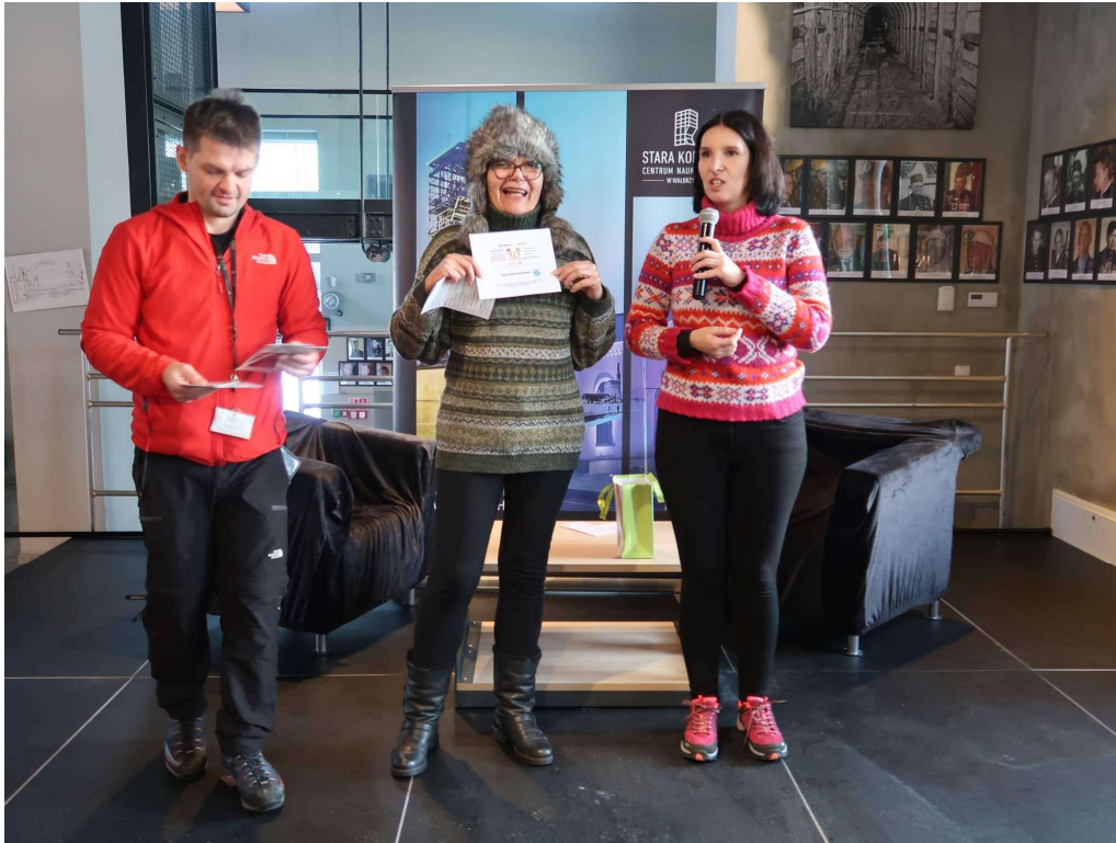
Na Qestowym spacerze z Prezydentem Miasta – testowanie Qestów